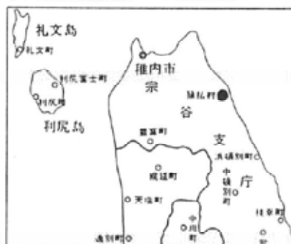
図表1 猿払村(さるふつむら) 人口3,155人(H2)、面積585.74km 2 、村の中を猿払川が流れているが、この川は「その源を天北山脈標高100mに発し、北流して、石炭別川、ボロナイ川、濁川、狩別川などの大小の支流を合流してオホーツク海に注ぐ流域面積374.0km 2 、流路延長59.5kmの2級河川」と説明されている。

考えてもみていただきたい。昭和28年当時の村役場の会計担当者が、開拓団の複式簿記と役所の官庁会計の区別がわかるのはかなり無理なことである。そこへもってきて、財政逼迫し、職員の給与を払うため、とにかく目前にある開拓団の金を流用したり